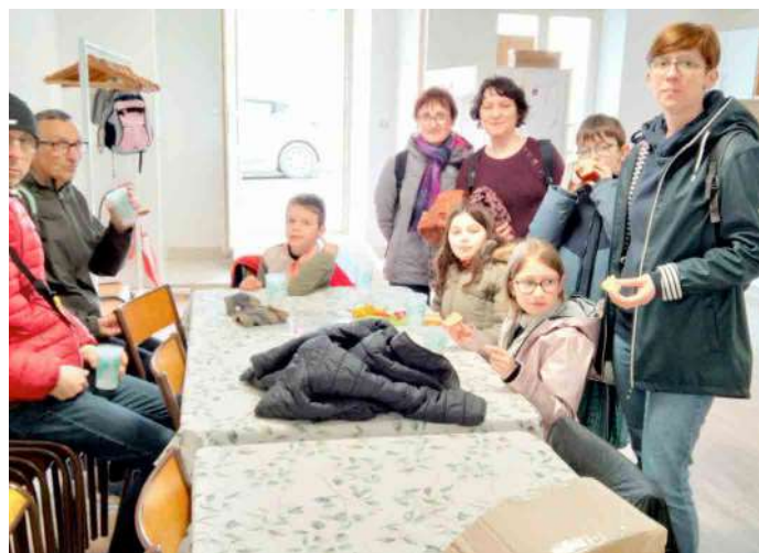
Les enfants, les parents et les accompagnateurs du club.