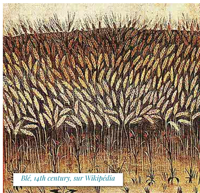
Blé, 14th century, sur Wikipédia

Mais un jour, il y a un grand bruit dans le grenier. Des hommes arrivent, avec de grosses pelles, et notre petit grain de blé, avec tous ses copains, est jeté dans une charrette. Et la charrette démarre, comme une promenade. Au hasard des secousses, le petit grain de blé voit tantôt un coin de ciel bleu, tantôt des jolies fleurs, tantôt un papillon, ou une coccinelle... C'est vraiment joli, bien plus beau que le grenier. Bientôt, tout le monde s'arrête, au bord d'un champ bien labouré. Sans ménagement, les hommes jettent le tas de blé dans un coin du champ. Ça fait un choc ! Mais c'est frais, c'est bon... Le grain de blé a le temps de faire une petite prière : « Mon Dieu je voudrais bien rester là, dans la fraîcheur, le plus longtemps possible... »