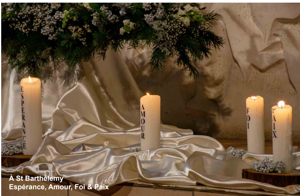
À St Barthélemy Espérance, Amour, Foi & Paix