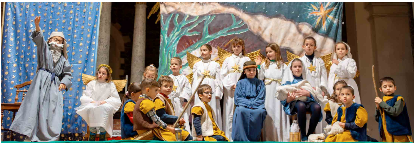
Veillée du 24 décembre à St Pierre de Trélazé