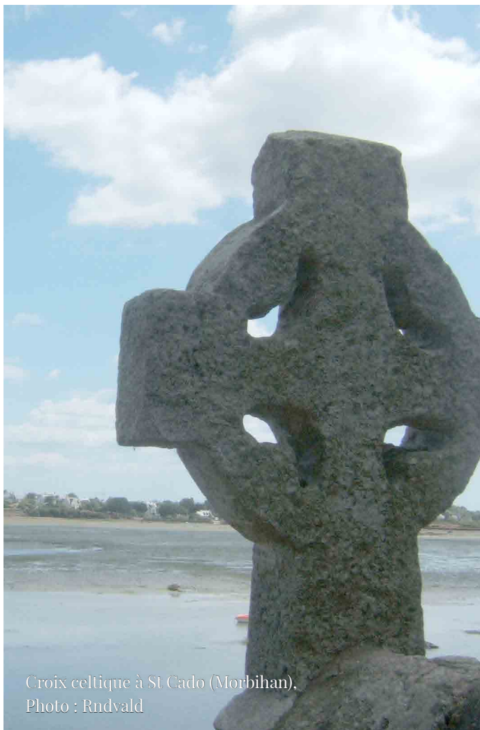
Croix celtique à St Cado (Morbihan), Photo : Rndvald