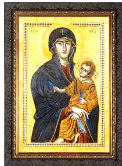
Icône de la Vierge, photo sur Wikipédia : SeoulKing