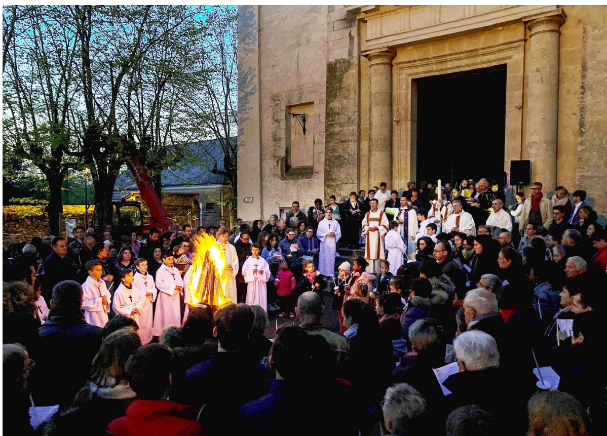
Le feu nouveau sur le parvis de l'église St Pierre de Trélazé (Paroisse Saint Lézin)