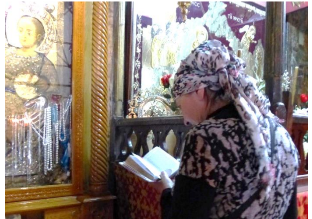
Basilique de la Nativité à Bethléem

En Hongrie, les non-croyants ne sont pas hostiles à l'Église. Les valeurs de la famille, du mariage sont profondément ancrées dans l'esprit hongrois.