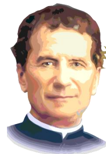
Saint Jean Bosco 1815-1888

Seigneur, accorde à mon âme de vivre de Toi Et de toujours éprouver la douceur de Ta présence !